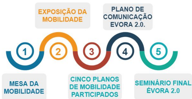
Figura 2: Produtos e ações resultantes do Évora 2.0.

Évora 2.0. pretende envolver 3 a 5 escolas do concelho de Évora e produzir, de forma participada, cinco produtos diferentes.