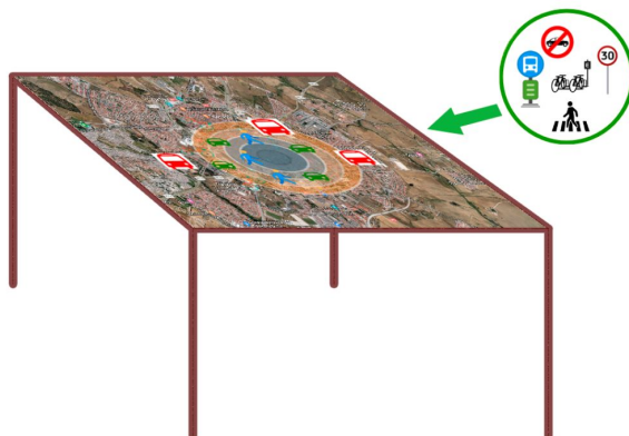
Figura 4: A mesa da mobilidade.

A Mesa da Mobilidade destina-se a animar uma sessão com a comunidade escolar. Nesta mesa, os utilizadores, a partir de um “layer” de círculos concêntricos (representam intervalos de distâncias até à Escola), informam (de forma anónima): a que distância residem da escola, como se deslocam para a escola, como gostariam de se deslocar e que soluções/medidas cada um preconiza para que essa intenção de mudança se concretize.