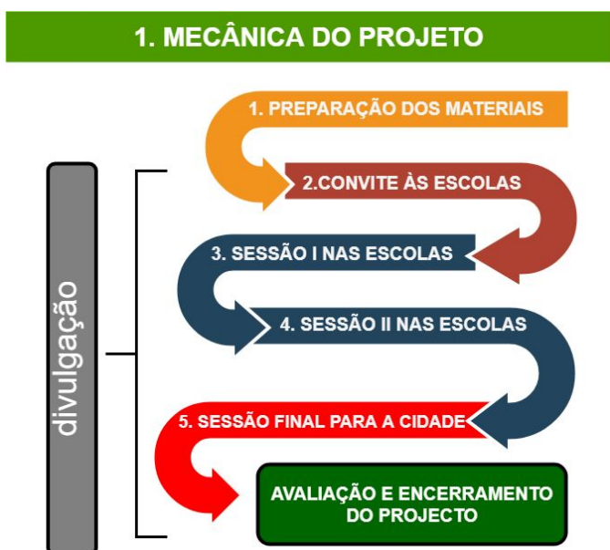
Figura 3: Mecânica geral do Projeto Évora Mobilidade 2.0.